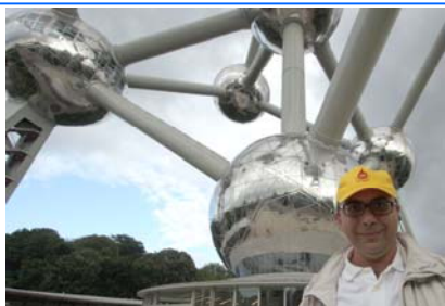
Un cappellino "San Marco" a Brussel