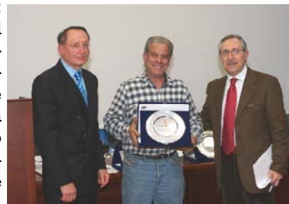
Un momento della premiazione degli over 65

Infine divertimento per tutti, con la tombola di beneficenza. La vendita delle cartelle, in offerta libera, ha permesso di raccogliere oltre 350 euro, che sono andati al progetto per la realizzazione di pozzi d'acqua nella missione Migoli in Tanzania.