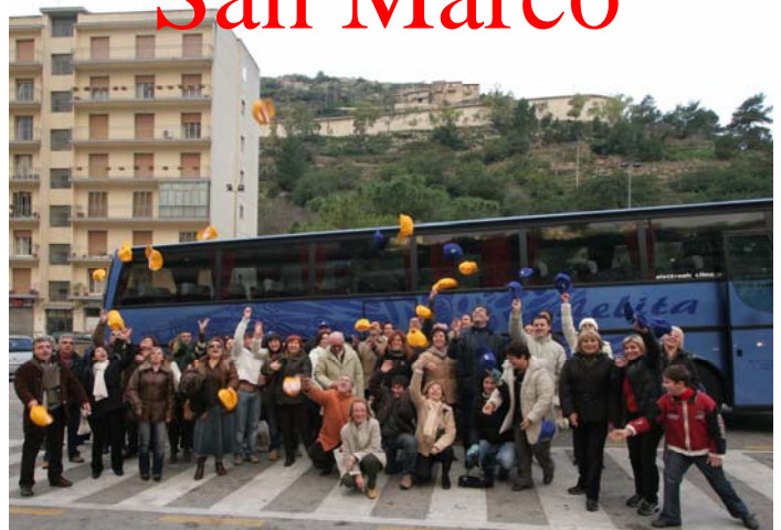
Momenti di gioia tra i donatori partecipanti alla gita di Modica e Ragusa Ibla del 6 gennaio '07